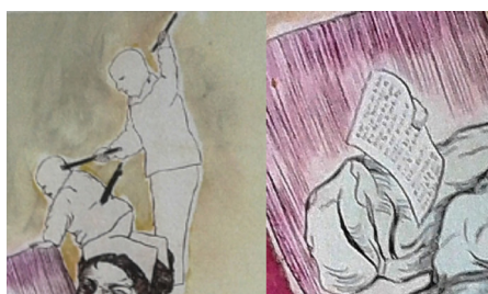
Figuras 15 y 16

El desfase de proporciones entre la Méndez, sentada en un sofá con vestido que deja brotar el pecho izquierdo, y los dos personajes que están a nivel de su cabeza dan a entender que el receptor está asistiendo a los pensamientos de la iza, quien acaba de redactar la carta que percibimos en el respaldo del sillón (Fig. 16); además, está «Con un Menino del padre» en la parte izquierda de la obra, lo cual retoma el incipit de la misma jácara. Esta segunda ilustración se ajusta pues al hipotexto escritural de Quevedo a la vez que autocita parte de la primera ilustración.