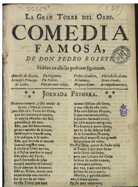
Reproducción de la portada del ejemplar BNE T/55329/4

Final (D4v), ornamento: adorno W2, 77,5 mm de alto y 106,5 mm.