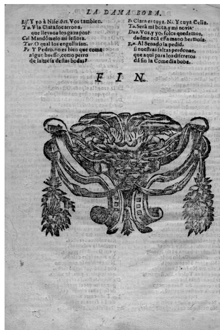
Reproducción de la última página del ejemplar BNE T/15003/20

Como en el caso anterior, la ausencia de paginación, de foliación y del número de serie indica que estamos, con probabilidad, ante una suelta de antes de 1700. De nuevo, el uso de la letra J vuelve a señalar que es poco probable que sea anterior a 1670, si se imprimió en Sevilla, o 1690, si se hizo en Madrid 34 . Centrándonos un poco más en sus particularidades, saltan a la vista las características y los rasgos que relacionan esta suelta S de La dama boba con la de La gran Torre del Orbe . El primero de ellos es, sin lugar a duda, el taco W2, que ocupa, de nuevo, una gran parte del espacio en blanco tras el final del texto (D2v) y que posee los mismos defectos que el de La gran Torre del Orbe . Su presencia sitúa la suelta a finales del siglo XVII en Sevilla.