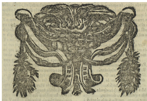
Reproducción del taco final del ejemplar BNE T/55329/4 de La gran Torre del Orbe

De acuerdo con su historia textual, este impreso se presenta como un valioso testimonio porque ofrece un texto que se situaría en la parte alta del estema de La gran Torre del Orbe 16 . Centrándonos en su examen desde la bibliografía material, la ausencia de paginación, de foliación y del número de serie, cuya incorporación se extendió hacia finales del siglo xvii 17 , indica que estamos, con una alta probabilidad, ante una suelta antigua; es decir, anterior a 1700. Si bien el cuarto sencillo era habitual, el uso de la letra J implica que es poco probable que sea anterior a 1670, si se imprimió en Sevilla, o 1690, si se hizo en Madrid 18 . De especial relevancia resulta el gran taco de madera que se adueña de casi todo el espacio sin texto en D4v. Este adorno lo hemos localizado en varias obras de finales del siglo xvii atribuidas a la imprenta de Juan Cabezas en Sevilla, como Relación verdadera, que da cuenta del espantoso temblor de tierra, que en la ciudad de Sevilla sucedió año de 1680 (Sevilla, Juan Cabezas, 1680). Los defectos y faltas de tinta en el adorno, compartidos por La gran Torre del Orbe y dicha Relación , situados en los bordes de los pomos de los márgenes superiores externos apuntan a que estamos ante el mismo taco: