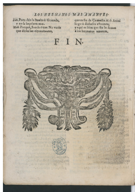
Reproducción de la portada del ejemplar BNE T/55294/14

El ornamento de este impreso nos traslada de nuevo a la imprenta sevillana de finales del siglo xvii, como deducimos de los adornos M3 y del gran taco de madera W2 en D4v, también con un notable desgaste. La distribución por líneas posee un parecido extraordinario con la de la suelta La gran Torre del Orbe , para la que incluso se ha usado hasta el mismo tipo dañado de la C del encabezado COMEDIA (línea 2, R1). Destacan asimismo los tipos de letra del encabezado JORNADA PRIMERA, idénticos a los de La gran Torre del Orbe . Este parentesco lleva a considerar esta suelta de la misma familia editorial; esto es, impresa en Sevilla, probablemente, entre 1676-1679 por Juan Cabezas.