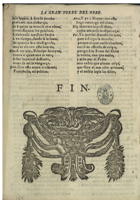
Reproducción de la última página del ejemplar BNE T/55329/4