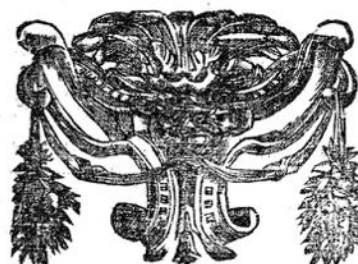
Reproducción de los datos de imprenta y el taco final en Relación verdadera que da cuenta del espantoso temblor de tierra que en la ciudad de Sevilla sucedió año de 1680 , Sevilla, Juan Cabezas, 1680

En Sevilla, por JUAN CABEZAS, en calle de Genova, año de 1680.