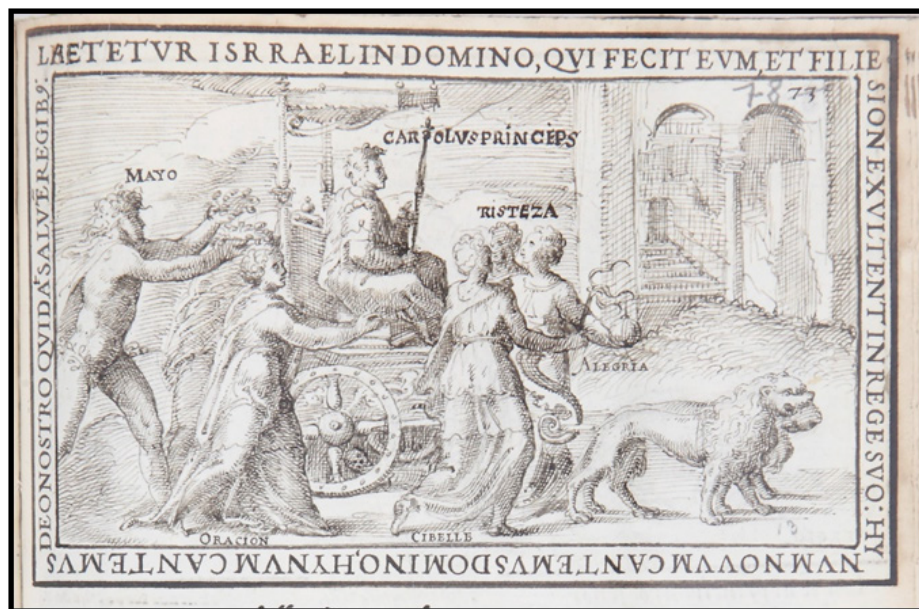
Fig. 8. Anónimo, Relación [Don Carlos en el carro de Cibeles, fol. 78r] , posterior a 1562. Dibujo a pluma (tinta sepia) sobre papel. inv. b-IV-18