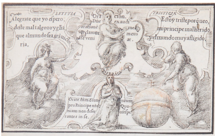
Fig. 2. Anónimo, Relación [Oración, junto a Esperanza, Tristeza y Alegría, fol. 6v], posterior a 1562. Dibujo a pluma (tinta sepia) sobre papel. Fuente: Patrimonio Nacional. Real Biblioteca del Monasterio de San Lorenzo de El Escorial (Madrid), inv. b-IV-18