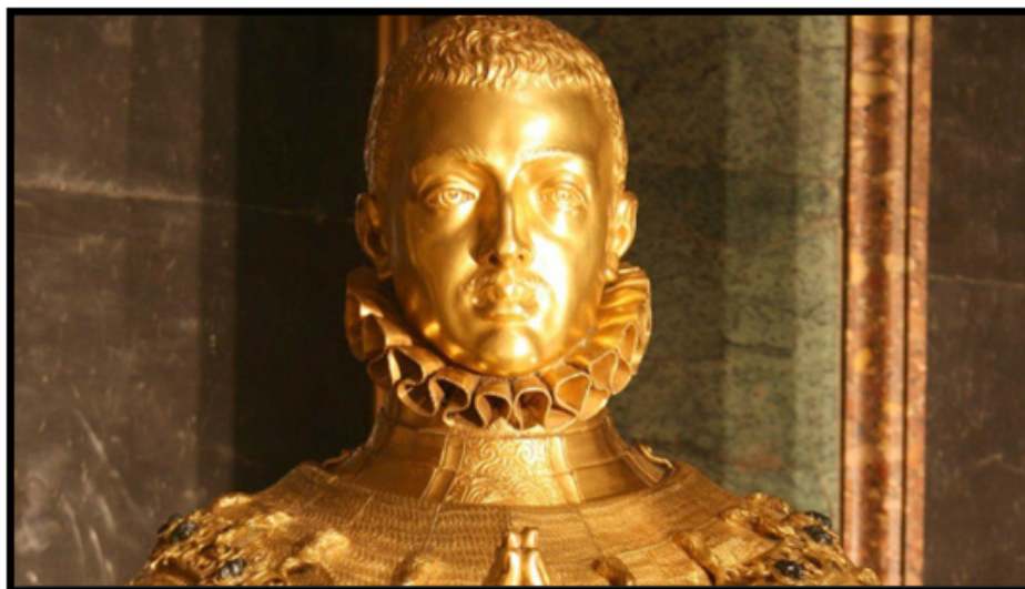
Fig. 11. Pompeo Leoni y colaboradores, Don Carlos, detalle del Cenotafio de Felipe II y su familia, c. 1585-1600. Bronce dorado. Basílica del Real Monasterio de San Lorenzo de El Escorial (Madrid), inv. 10034776