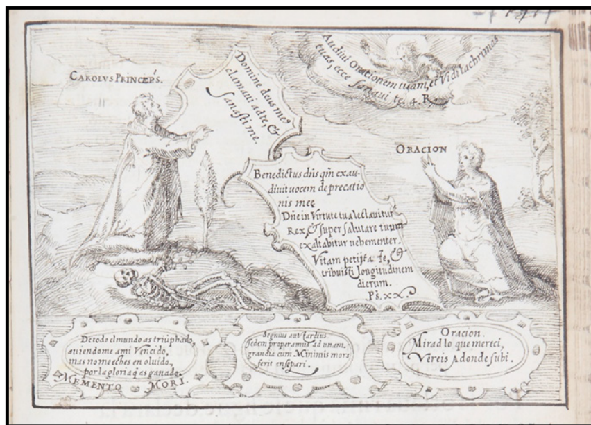
Fig. 7. Anónimo, Relación [El príncipe Carlos y la Oración, fol. 77r] , posterior a 1562. Dibujo a pluma (tinta sepia) sobre papel. Fuente: Patrimonio Nacional. Real Biblioteca del Monasterio de San Lorenzo de El Escorial (Madrid), inv. b-IV-18