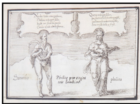
Fig. 5 (derecha). Anónimo, Relación [La fragua de Vulcano, fol. 8r], posterior a 1562. Dibujo a pluma (tinta sepia) sobre papel.