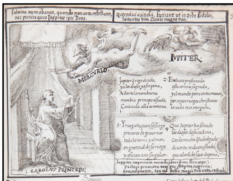
Fig. 10. Anónimo, Relación [Mercurio entrega una corona al príncipe don Carlos, fol. 79r], posterior a 1562. Dibujo a pluma (tinta sepia) sobre papel. Fuente: Patrimonio Nacional. Real Biblioteca del Monasterio de San Lorenzo de El Escorial (Madrid), inv. b-IV-18