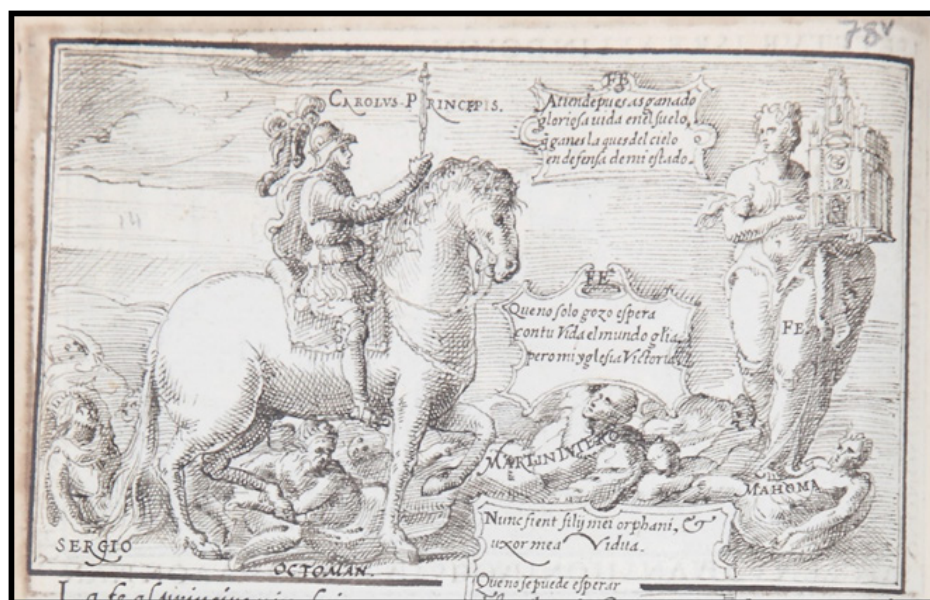
Fig. 9. Anónimo, Relación [Don Carlos a caballo vence a los herejes, fol. 78v], posterior a 1562. Dibujo a pluma (tinta sepia) sobre papel.