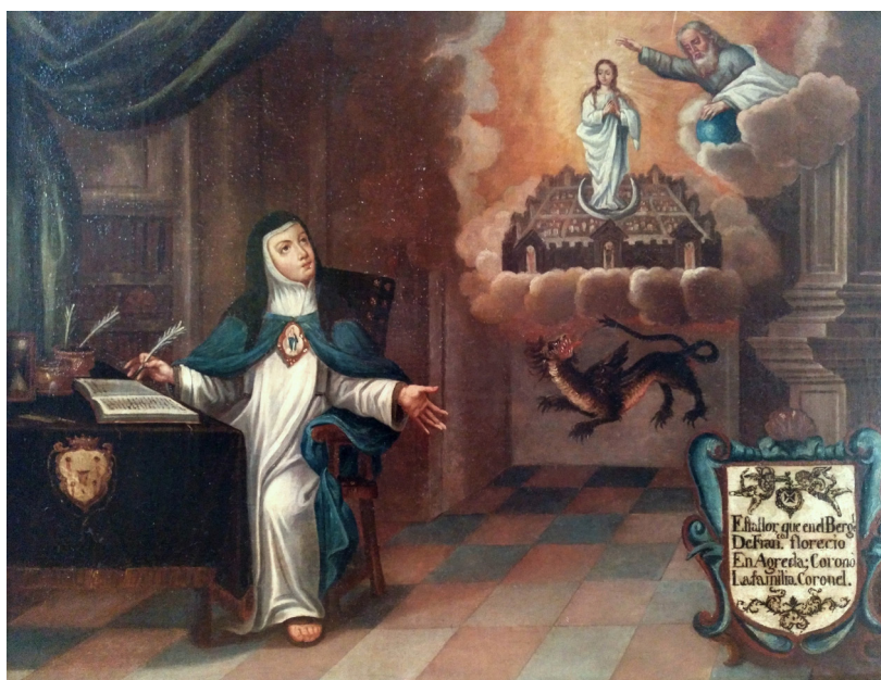
Fig. 1. Óleo anónimo, escuela española o novohispana, finales del siglo XVII-principios del siglo XVIII. Colección particular.

El presente trabajo es parte del análisis de una pintura de procedencia desconocida 1 , hoy en colección particular que se aparta, por diversas razones, de la iconografía más conocida de la Venerable. Se trata de una escena que presenta a sor María escribiendo en un bufete, rodeada de libros, mientras contempla la aparición de la Inmaculada sobre la Jerusalén celeste, amparada por Dios Padre. Debajo, aparece el dragón infernal (Fig. 1). En el ángulo inferior derecho del espectador se encuentra una cartela de gran tamaño, en forma de escudo, con un texto alusivo. Se rodea de cartones recortados y agallas de tradición manierista, rematados por una venera.