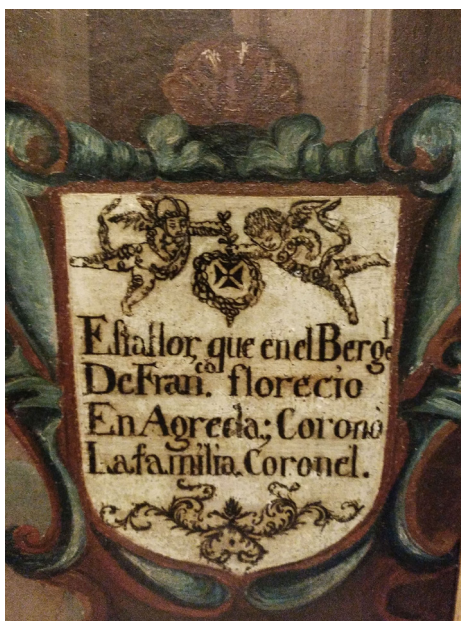
Fig. 2. Cartela en la parte inferior derecha.

Esta flor, que en el vergel de Fran[cis]co floreció en Ágreða, coronó la familia Coronel.