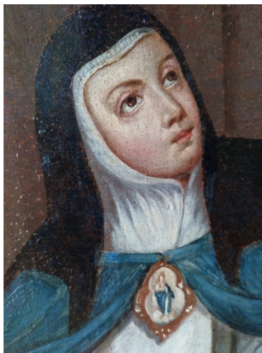
Fig. 5. Detalle de la pintura, con posible retrato de sor María.

Volviendo a la pintura que se estudia, la referencia a la Venerable como miembro y corona de la familia Coronel es, sin duda, anterior a la creación iconográfica del árbol familiar y, la mención directa a su ascendencia nos lleva a conjeturar que el pintor pudo esforzarse en presentar el rostro real de la religiosa, quizás tomado de un retrato verdadero —vera efigie— y, de ser así, cual es su fuente (Fig. 5). En todo caso, no debe olvidarse que estamos ante una representación póstuma en la que, por alguna razón, se ha preferido presentar muy joven a la madre Ágreda, quizás en referencia a los inicios de su producción literaria 40 .