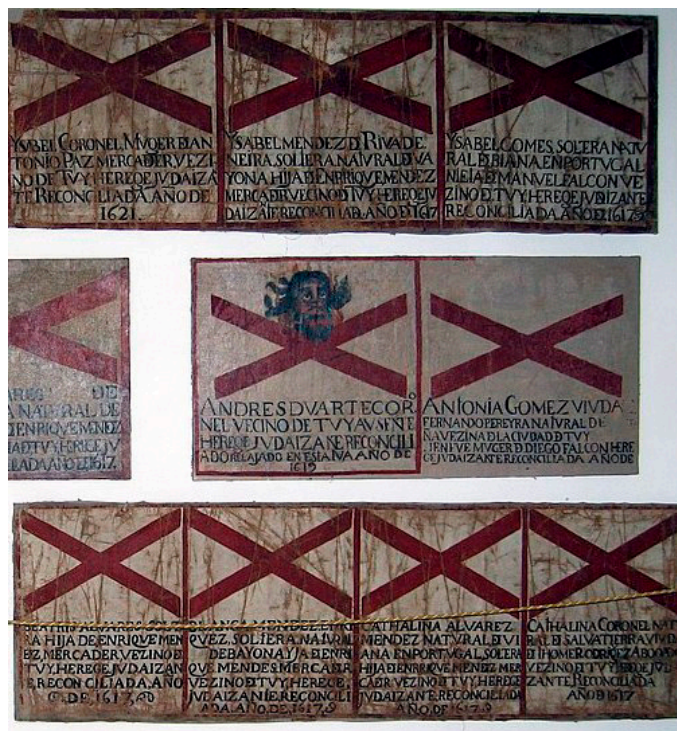
Fig. 3. Sambenitos. Museo Diocesano de Tuy. Detalle.

Curiosamente, el grupo más numeroso de sambenitos, en cuanto a prendas infamantes, conservado en España, es el de la Catedral de Tui (Fig. 3). Su calidad de testimonios materiales de la historia ha atraído el interés de los especialistas en indumentaria y de los historiadores interesados en conocer los procesos de los que formaron parte, y también aquí tienen los Coronel un destacado protagonismo 31 .