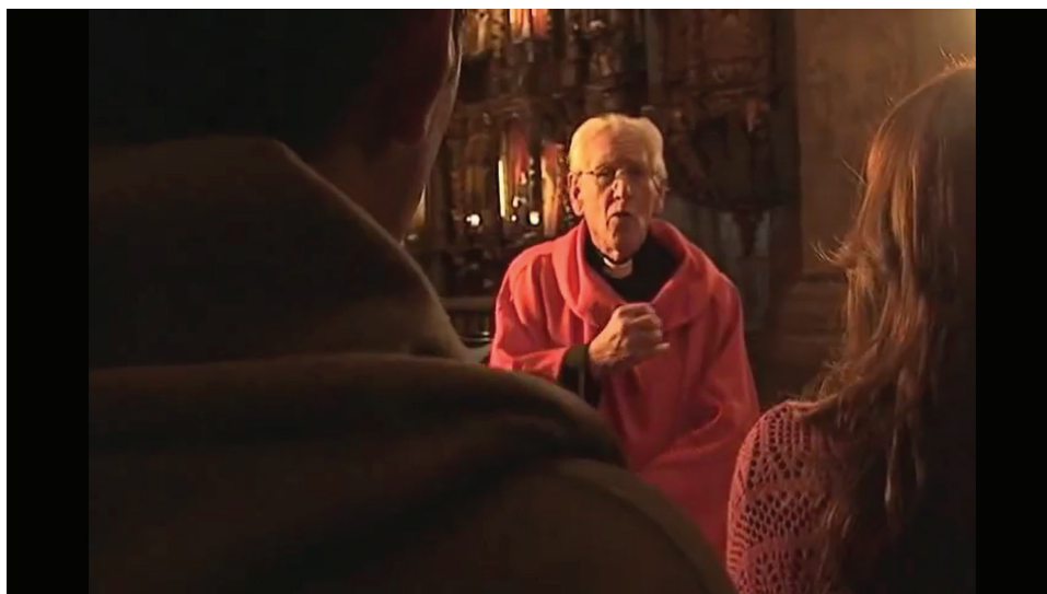
Imagen 2: Obermaier narra, dentro del santuario, la historia de la talla de la Virgen

La primera historia de dichos milagros es sobre una madre y su hijo enfermo, desahuciado por los médicos. En la segunda, un terremoto que remece Copacabana provoca que un niño y su madre se separen; el menor termina perdido e inconsciente en las afueras de la ciudad. En la tercera historia, una madre, enferma