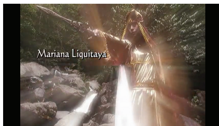
Imagen 19 34

Luego, Tito invoca a la Virgen, «Virgen mamita, ayúdame», tras lo cual desfallece. A continuación, la Virgen se manifiesta en la cascada, vestida con un traje dorado y portando una espada (imagen 19). Las tres mujeres muestran, entonces, su naturaleza demoníaca. Mientras que la Virgen se enfrenta y vence al Demonio que había tentado a Tito (imagen 20), dos ángeles hacen lo mismo con los otros dos. Terminado el combate, el adolescente recupera la conciencia y agradece a la Virgen por su ayuda. De este modo, en esta escena, se muestra una Copacabana evangelizada, en la que ya no son las divinidades aimaras las que combaten al Demonio, pues la invocación de Tito al achachila Illimani no tiene efecto. Su lugar ha sido tomado por la Virgen, quien funge como la protectora de este pueblo. Al avanzar la película, ella misma, veinte años después, se manifiesta en un sueño a Tito para solicitarle que realice su talla.